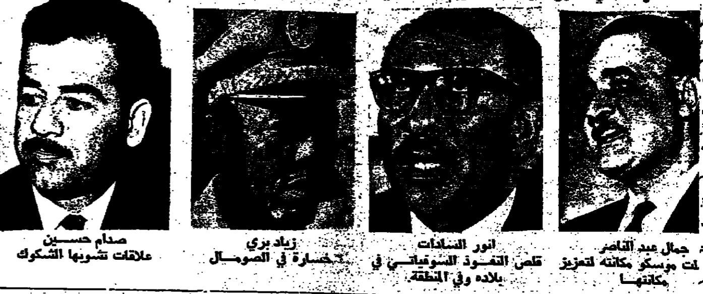
صدام حسين، علاقات تنويرها الشكوك. زيايد بري، خسارة في الصومال. انور السادات، قاص التعمود السوفياتي في بلاده وفي المنطقة. جمال عبد الناصر، مكنتها.

التمن الباهظ بقي ان نتطرق الى كيف تطوور الاتحاد السوفياتي - في علاقته السياسية بدول المنطقة - خسر موقعه في كبرى دول المنطقة: في مصر. وبالاضافة الى ذلك فان علاقته بالعراق اليوم ليست كما كانت عليه في الماضي، بعد ان اصبح طابع هذه العلاقات اليوم الشك والتشكيك. كما ان علاقته مع سوريا تتعرض بين الحين والآخر للاهتزاز، وازاء هذه الخسائر في قلب الشرق الاوسط، فقد عزز الاتحاد السوفياتي مكانته في ليبيا وفي عدد من الدول التي تقع على حاشيتي منطقة الشرق الاوسط، واليونان، وقد عزز مكانته في هذه الدول الاخرى على حساب مكانته في الصومال.